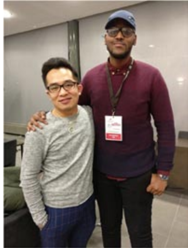
kuvassa minä ja kampanjatiimin jäsen

Moni tosiaan harkitsee yhä lähtevänsä mukaan kuntavaaleihin. Vielä ei ole myöhäistä!